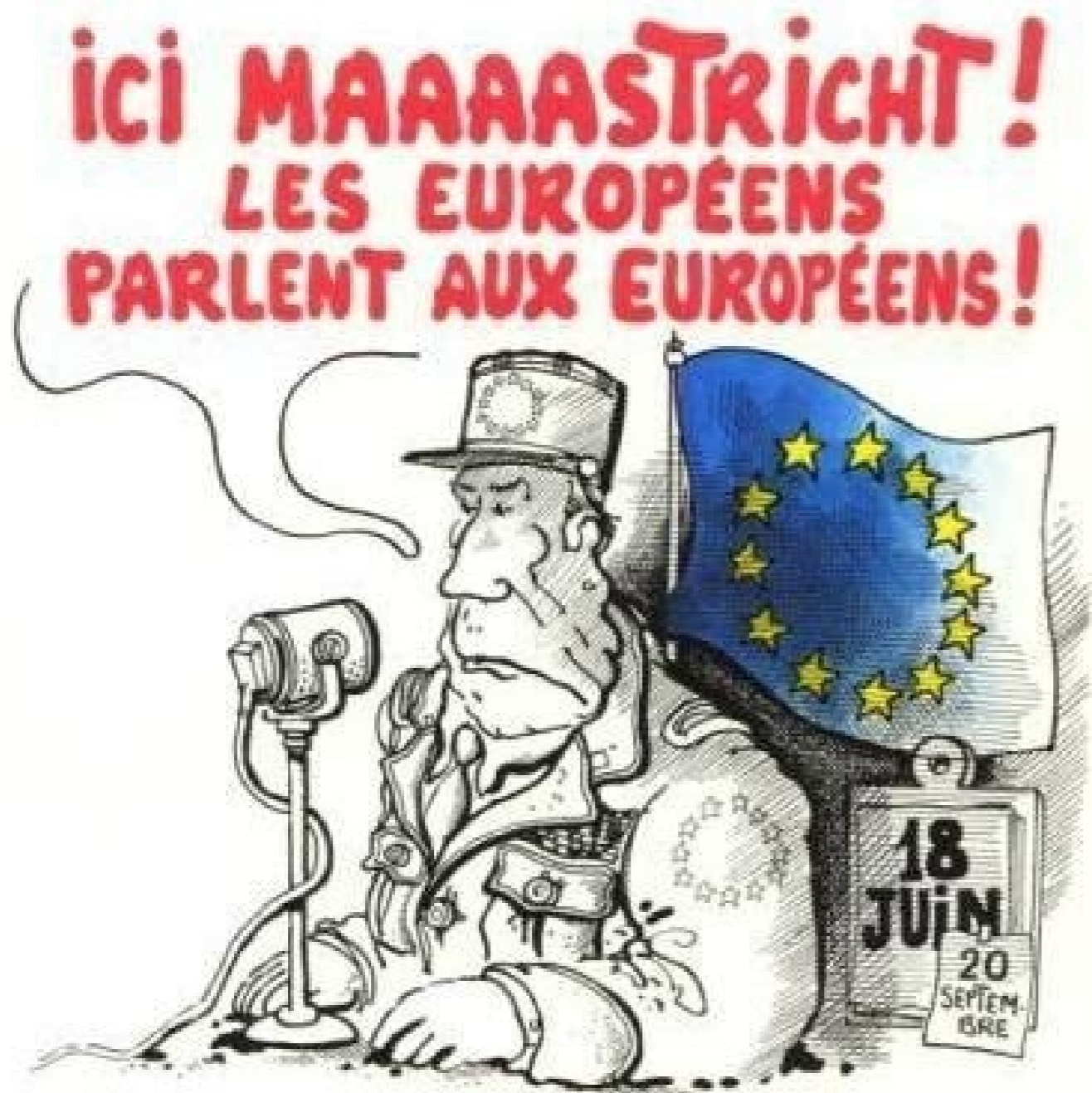
Dessin de Plantu ("Le Monde")